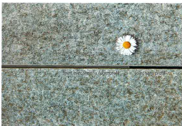
Présentation discrète des joints. Grâce au profil remplissant les joints, presque pas de joint d'ombre.