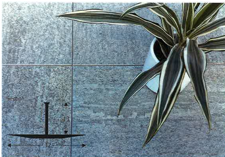
Les mauvaises herbes n'ont aucune chance sur les dallages avec steifix profil de joint.

Les profils usagés peuvent nous être renvoyés pour recyclage.