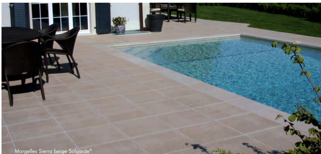
Margelles Sierra beige Solgarde®